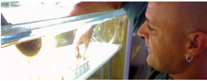
BEISPIELE GELUNGENER INTEGRATION.